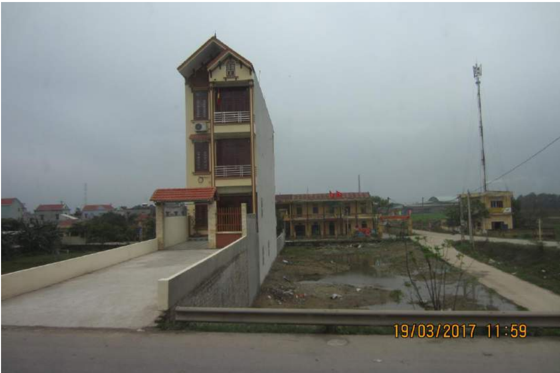
Vietnamilainen tonttijako poikkeaa suomalaisesta