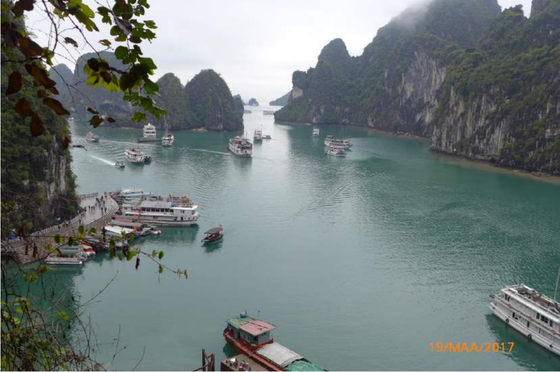
Halong Bay oli odotusten mukainen, kaunis UNESCO:n World Heritage -alue.