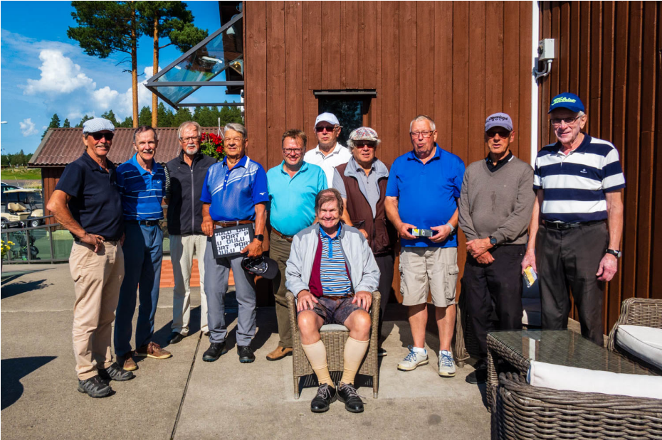
Pohjois-Suomen RIL-Senioreiden perinteinen golfturnaus järjestettiin 5.8.2021 aurinkoisella Sankivaaran kentällä.